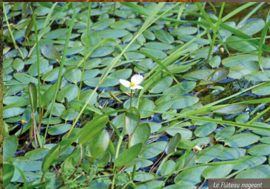
Le Flûteau nageant